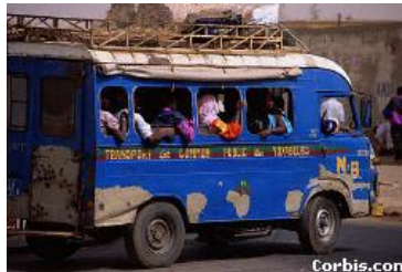
Bone haa Dakar

suklanaago kuugal bee semmbe ngam haa mi wafan-e haajeeji ma bana no haani." Haala seedugo bee baaba am ka fottanaay yam boodfum, ammaa mi yidaa laskingo mo bernde. Janngo fajiri, bana o wi'ino, min ndilli Dakar.