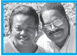
Yunussa bee debbo mum